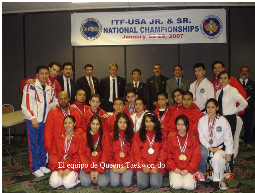
El equipo de Queens Taekwon-do

Durante el pasado fin de semana se llevo a cabo el campeonato nacional para juveniles y adultos en Orlando, Florida. Para nuestro equipo QTC el resultado fue altamente positivo. Los resultados fueron buenos y dejaron en claro que tenemos madera para competir. Que el sacrificio y esfuerzo realizado por nuestros estudiantes tiene un precio y ese precio es ser parte del equipo de USA que nos representara en Canadá 2007 durante el Campeonato Mundial de la ITF para adultos y juveniles. Con la participación de Texas, Arizona, California, Alaska, Arizona, Florida, New Cork, New Jersey, Connecticut, Pensilavani, New Mexico, y otros estados que se me escapan de la mente, nuestros estudiantes lograron los siguientes resultados en la competencia clasificatoria para el mundial.