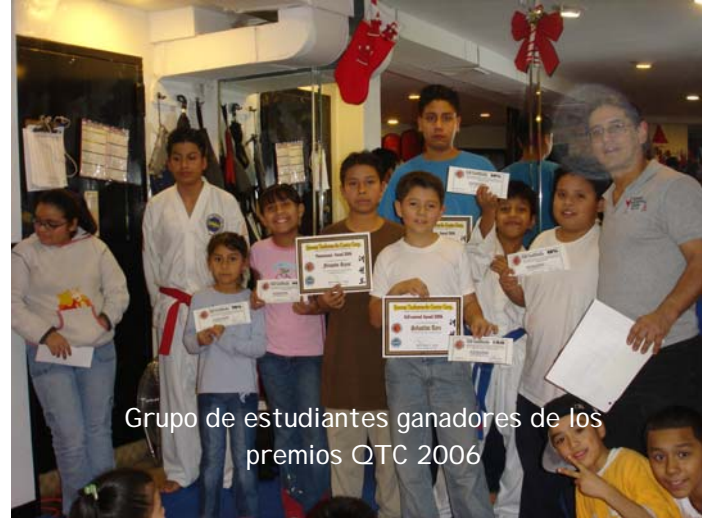
Grupo de estudiantes ganadores de los premios QTC 2006

A cada estudiante se le entrego un bono por el valor de $50.00 que lo puede utilizar en la escuela para el pago de la mensualidad o para adquirir implementación.