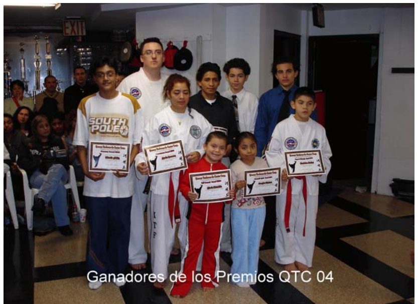
Ganadores de los Premios QTC 04